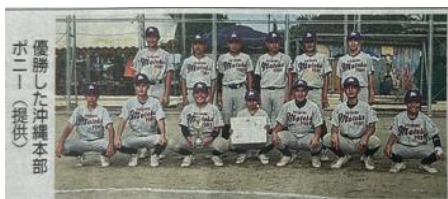
琉球新報 R7. 11. 25掲載